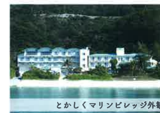
とかしくマリビレッジ外観